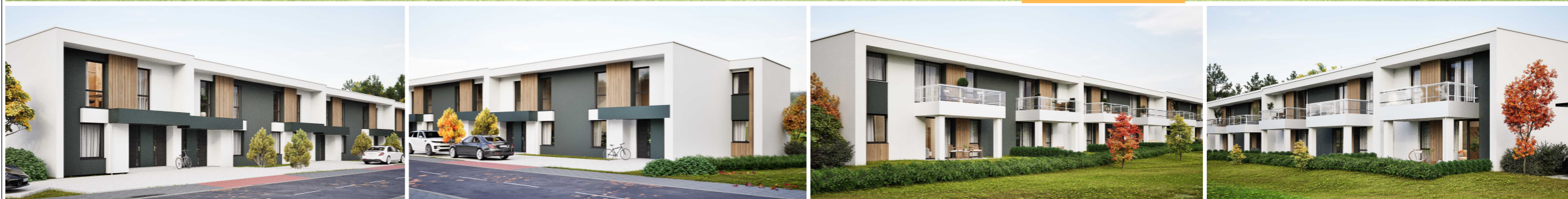
BUDYNEK NR 3 LOKAL B PIĘTRO